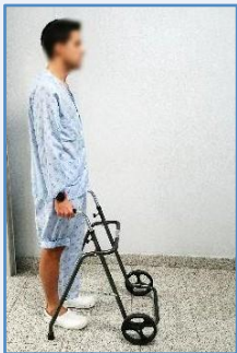
Agarre el andador con fuerza