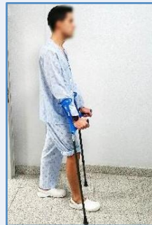
Adelante la pierna operada