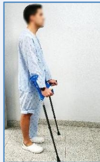
Adelante las muletas