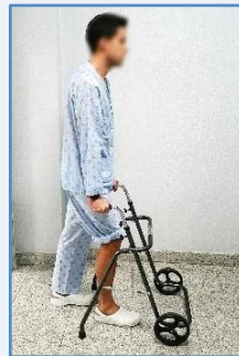
Adelante la pierna operada