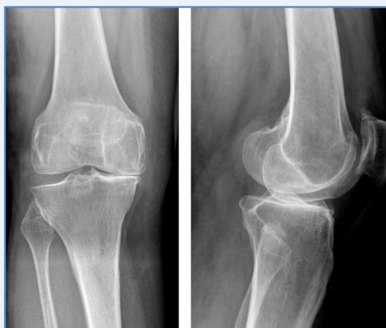
Antes de la intervención