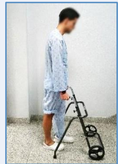
Adelante la pierna sana