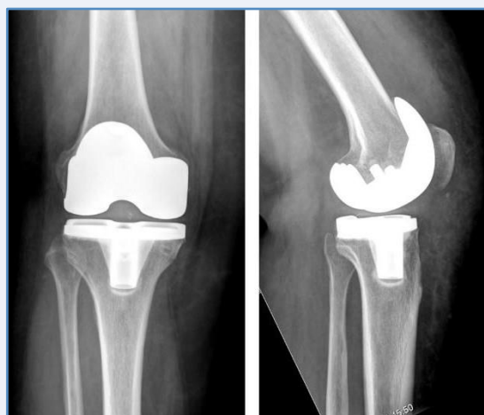
Después de la intervención