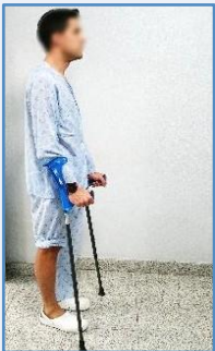
Agarre las muletas con fuerza