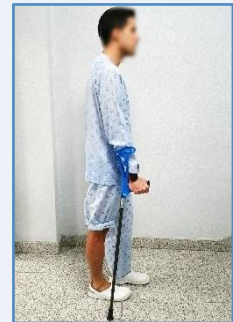
Adelante la pierna sana