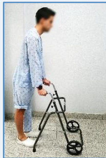
Adelante el andador